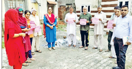
जींद। लोगों को जागरूक करते स्वास्थ्य कर्मी।