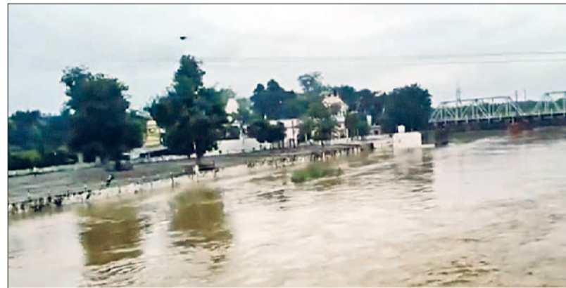
जींद। बरसात के कारण भरा पानी।