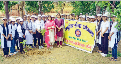
जींद। पौधारोपण कार्यक्रम के दौरान मौजूद प्राचार्य और छात्राएं।