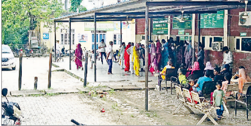
जींद। नागरिक अस्पताल की लैब में लाइन में लग रिपोर्ट लेते हुए।

एडीसी ने नागरिक अस्पताल का दौरा किया और व्यवस्थाओं का जायजा लिया