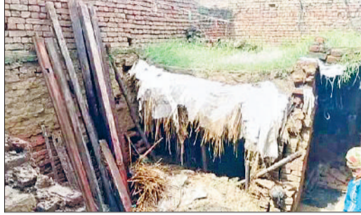
जुलाना। करेला गांव में बरसात से गिरी छत।

आसपास नहीं थे। जिस पर बैंक द्वारा मकान पर कब्जा कार्रवाई की गई।